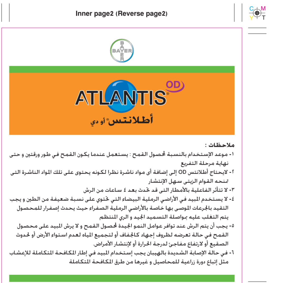
Atlantis OD / KSA 5-L- Booklet Inner page 2 (Reverse page 2) (125x135mm)