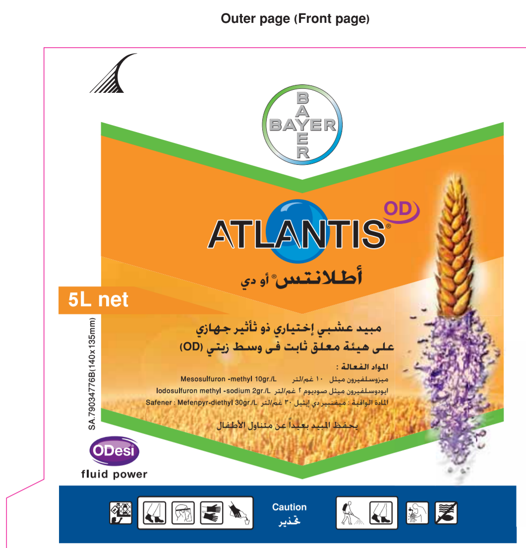
Atlantis OD/ KSA 5-L- Booklet Base page (Carrier) (150x135mm)