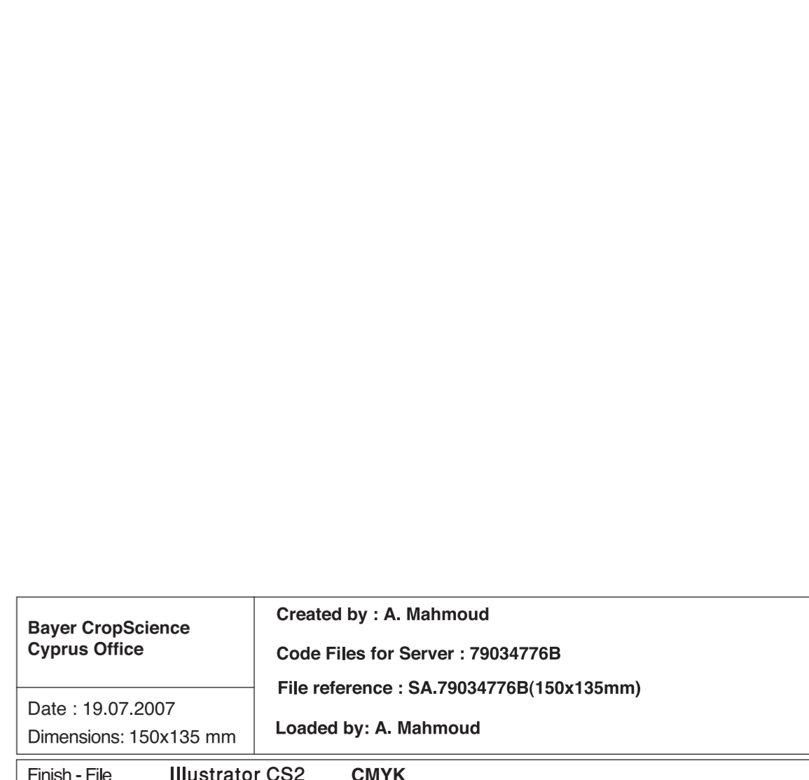
Atlantis OD / KSA 5-L- Booklet Base page (Carrier) (150x135mm)