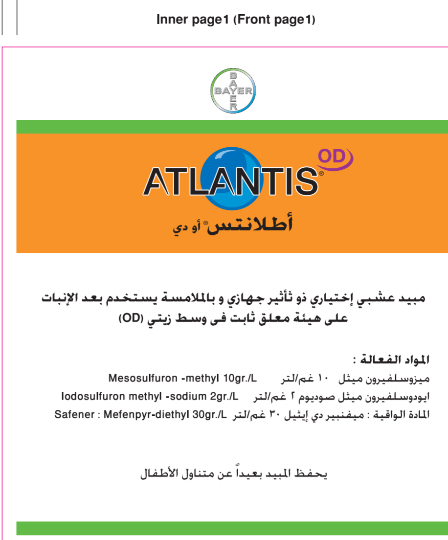
Atlantis OD / KSA 5-L- Booklet Inner page 1 (Front page 1) (125x135mm)