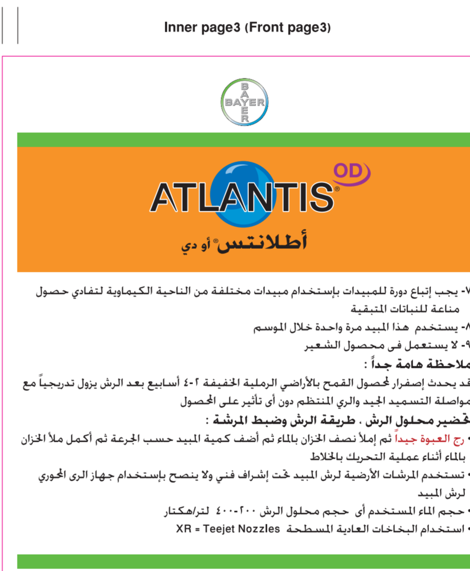
Atlantis OD / KSA 5-L- Booklet Inner page 3 (Front page 3) (125x135mm)