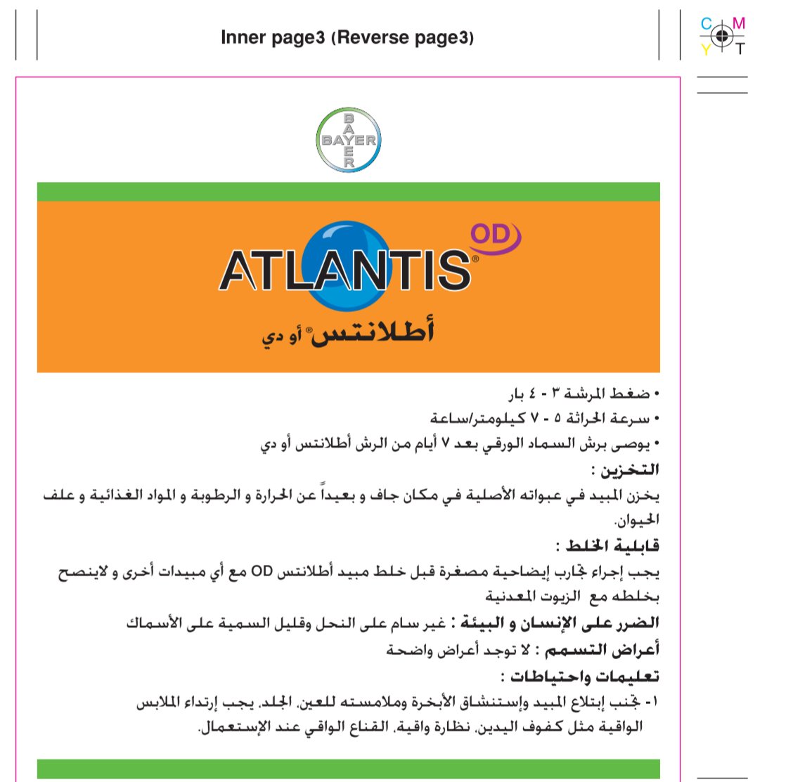
Atlantis OD / KSA 5-L- Booklet Inner page 3 (Reverse page 3) (125x135mm)