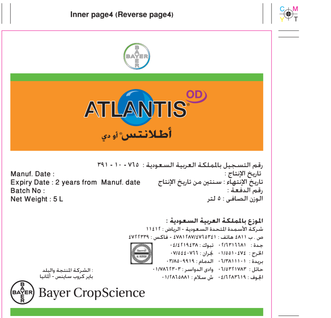
Atlantis OD / KSA 5-L- Booklet Inner page 4 (Reverse page 4) (125x135mm)