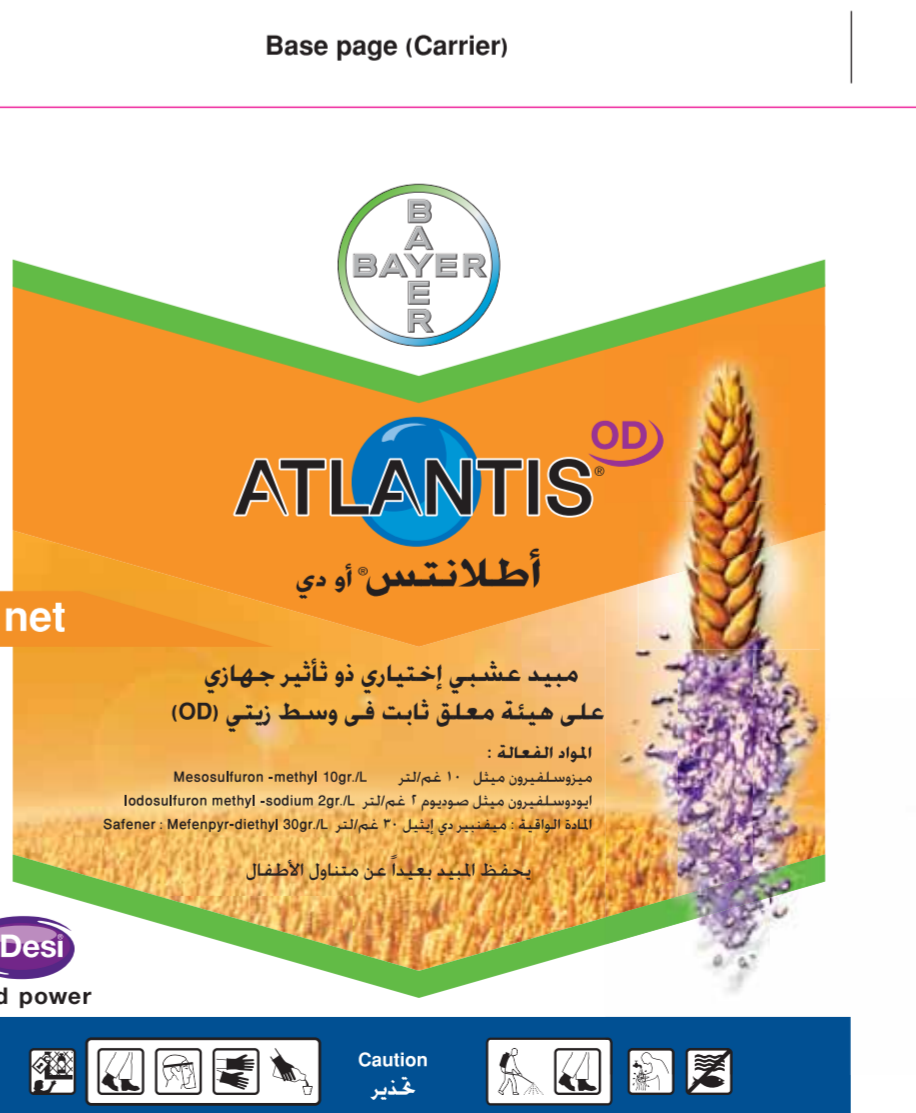
Atlantis OD / KSA 5-L- Booklet Base page (Carrier) (150x135mm)