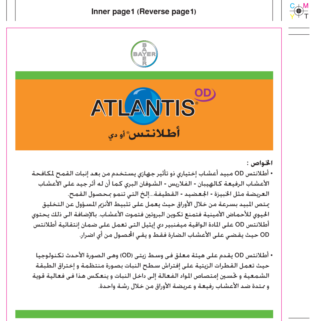
Atlantis OD / KSA 5-L- Booklet Inner page 1 (Reverse page 1) (125x135mm)